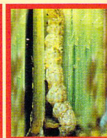
Tryporyza innotata Penggerek batang