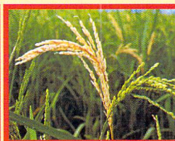
Whitehead Gejala beluk