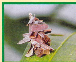
Metisa plana Ulat kantong