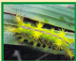
Thosea asigna Ulat api