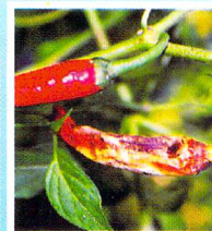
Antraknosa Pada Cabai ( Cercospora Capsici )