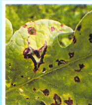
Antraknosa Pada Semangka ( Colletotrichum sp. )