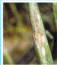
Embun Bulu Bawang Daun ( Peronospora destructor )